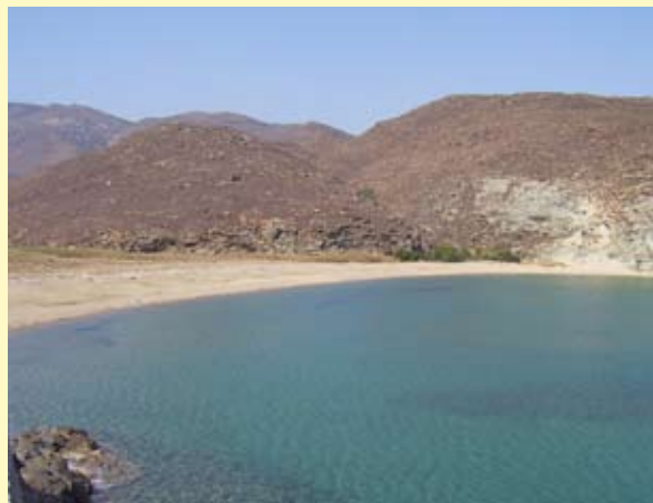
Η παραλία της μεγάλης άμμου

Επίσης λίγο πιο πάνω από την παραλία υπάρχει δυνατότητα διαμονής στην ξενοδοχειακή μονάδα της Βικτορίας που είναι στο ύψωμα αποτελούμενη από 12 δωμάτια αλλά και να καθίσετε για φαγητό στο εστιατόριο που διαθέτει από όπου μπορείτε να χαρείτε όλη την θέα του κόλπου.