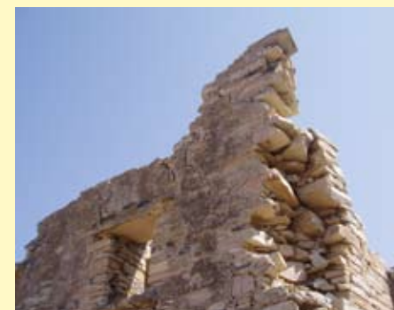
Ερειπωμένο σπίτι του χωριού

Εκτός από την σπουδαία σωζόμενη αρχιτεκτονική των ερειπωμένων σπιτιών, αξιό-