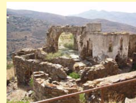
Ερειπωμένο σπίτι του χωριού