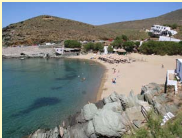
Η παραλία της μικρής άμμου

Η μικρή άμμος, μια από τις καλύτερα οργανωμένες παραλίες της Τήνου, προφυλαγμένη από τον βοριά. Οι απόλυτα εναρμονισμένες με το περιβάλλον ομπρέλες του Γεωργίου Σάββαρη θα σας προφυλάξουν από τον δυνατό ήλιο, αλλά και από