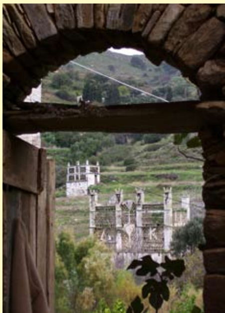
Περιστεριώνες στην Περάστρα

Το χωριό που αποτελείσε το πέρασμα από τα κάτω μέρη προς την χώρα, απ' αυτό άλλωστε πήρε και το όνομά του, ένα πανέμορφο χωριό με λίγους κατοίκους. Χαρακτηρίζεται από τα δύο πετρόκτιστα γεφύρια μέσα στο πράσινο και τα νερά, που κατεβαίνουν από το μεσαιωνικό χωριό Λάζαρο. Μέσα στο χωριό υπάρχει το ερειπωμένο πια, παλιό ελαιοτριβείο, καθώς και ένας από τους πιο πλούσια διακοσμημένους περιστεριώνες της Τήνου, κατασκευής του 1927. Οι 13 νερόμυλοι κατά μήκος της λαγκαδιάς όπου οι κάτοικοι των γύρω χωριών έφερναν το σιτάρι για άλεσμα βρίσκονται απέναντι από το μονοπάτι που