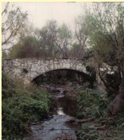
Το γεφύρι της Περάστρας δίπλα από το ελαιοτριβείο

Η Εκκλησία του χωριού είναι αφιερωμένη στον Άγιο Γεώργιο αλλά με πρωτοβουλία του Συλλόγου γιορτάζει και την Ανάσταση την δεύτερα του Πάσχα, όπου μαζεύεται πολύς κόσμος. Έξω από την εκκλησία του Αγ. Γιώργη μπορεί κανείς να ξεδιψάσει με το τρεχούμενο νερό της πηγής. Τον δεκαπενταύγουστο γιορτάζει το παρεκκλήσι της Παναγίτσας.