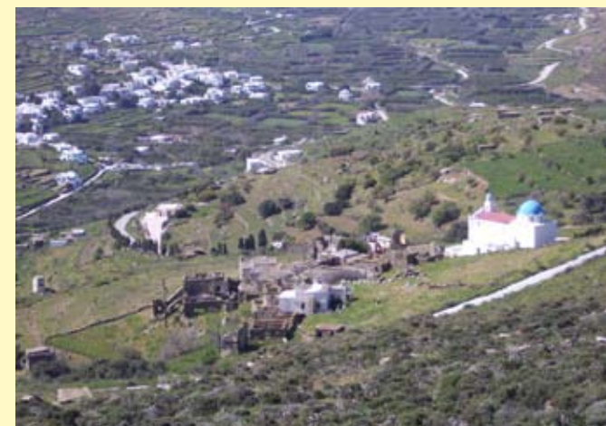
Τα Μοναστήρια από ψηλά

Ένα χωριό δυστυχώς ερειπωμένο. Τα Μοναστήρια αν και βραχαιόκτητο χωριό έχει γίνει πολύ γνωστό χάρη στη μοναδικά σωζόμενη αρχιτεκτονική του. Το τελευταίο σπίτι έκλεισε