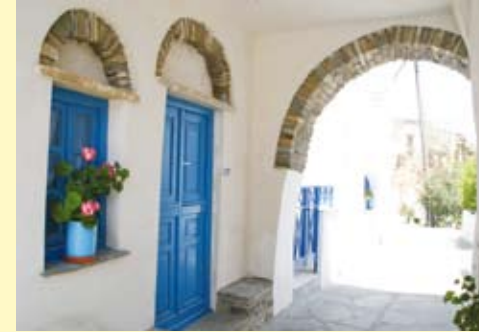
Καμάρα εσωτερικά του χωριού

ρι αλλά και το ξακουστό πανηγύρι του χωριού στις 29 Αυγούστου με ντόπιους μεζέδες και παραδοσιακό γλέντι μέχρι το πρωί. Λίγο πιο πέρα συναντάμε το παραδοσιακό παντοπωλείο της Ζωζέφας, τις καμάρες του χωριού και κατηφορίζοντας προς την κάτω Κώμη συναντάμε το σχολείο με το μνημείο των πεσόντων και το ηλιακό ρολόι. Συνεχίζοντας τη διαδρομή στο κεντρικό δρόμο του χωριού, συναντάμε το παντοπωλείο του Κορίνθιου και την εκκλησία της Παναγίας. Προς το τέλος του χωριού αξίζει κανείς να σταματήσει στις πηγές με το άφθονο κρύο, πόσιμο νερό και δίπλα τις πλύστρες που έπλεναν παλιά οι γυναίκες της κάτω Κώμης.