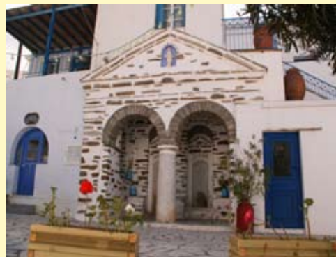
Το πηγάδι στη μέσα Κώμη

Στην μέσα Κώμη μπορούμε να δούμε την επιβλητική εκκλησία του Αγίου Ιωάννη, πρόσφατα ανακαινισμένη. Εξωτερικά μπορεί κανείς να θαυμάσει την ιστορική αρχαία μαρμάρινη κολώνα από ψήφισμα του δήμου της εποχής εκείνης, πάνω στο υπέροχο βοτσαλωτό προαύλιο, καθώς και τις επιβλητικές μαρμάρινες κολόνες με τα κιονόκρανα εντοιχισμένες στο εξωτερικό μέρος της αυλής, πιθανότατα, ερείπια από Ιερό του Ποσειδώνα που στην αρχαιότητα βρισκόταν σ' αυτή τη θέση. Ενώ εσω-