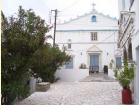
Η εκκλησία του Αγίου Ιωάννη

Ένα από τα πέντε κεφαλοχώρια του νησιού! Από το 1907 μέχρι το 1934 αποτέλεσε την έδρα του δήμου Περαίας, έπειτα δημιουργήθηκε η κοινότητα που συμπεριλάμβανε τα χωριά Περάστρα, Μοναστήρια, Κρόκο και Σκαλάδο. Σήμερα ανήκει στον δήμο Εξωμβούργου και έχει 400 κατοίκους. Παλαιότερα υπήρχε μόνιμο ιατρείο, αστυνομικό τμήμα και δημοτικό σχολείο. Το λιβάδι που ξεκινά μπροστά από το χωριό και καταλήγει στην μεγάλη παραλία της