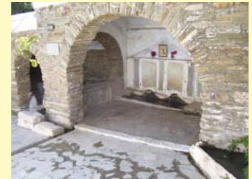
Το πηγάδι στην κάτω Κώμη